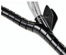
Рисунок 2 – Пример монтажа / Figure 2 – Mounting example